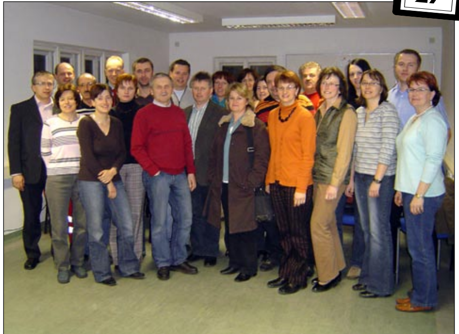
Abschlussfoto des Erste-Hilfe-Kurses für Mitarbeiter der Sparkasse und des Gemeindeamtes Groß Gerungs.