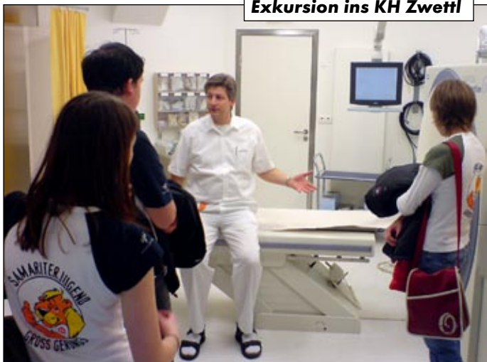
Exkursion ins KH Zwettl

An dieser Stelle bedanken wir uns auch bei unseren Jungsamaritern für ihre Unterstützung und Hilfe bei den unterschiedlichen Veranstaltungen. Wir freuen uns auf ein gemeinsames neues aktives Jahr!