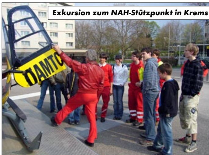
Exkursion zum NAH-Stützpunkt in Krems