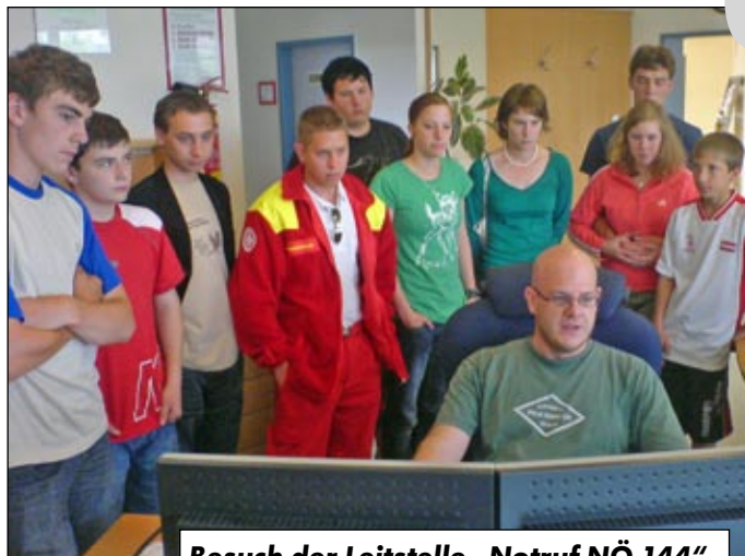
Besuch der Leitstelle „Notruf NÖ 144“