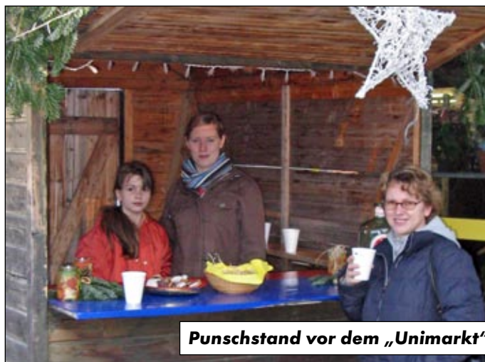
Punschstand vor dem „Unimarkt“